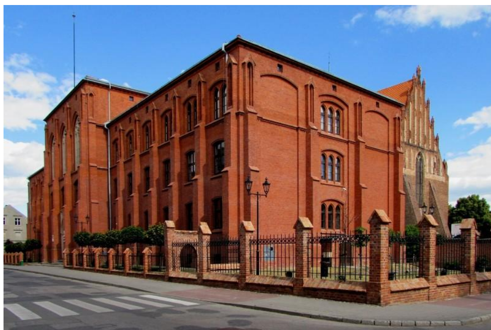
Budynek Liceum Ogólnokształcącego w Chełmnie.