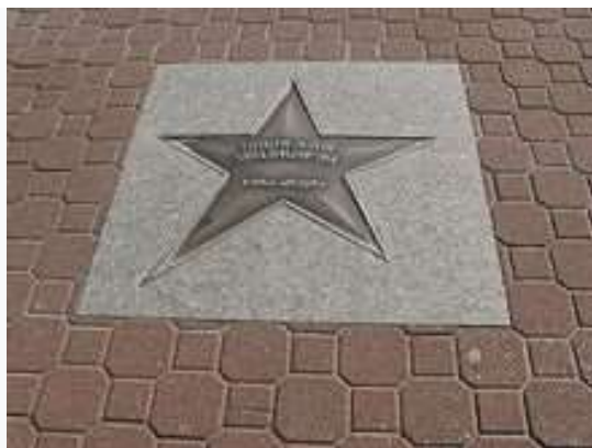
Gwiazda w Alei Gwiazd Sportu we Władysławowie