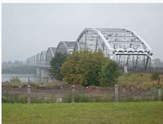
Most im. Bronisława Malinowskiego w Grudziądzu

Bronisław Malinowski (ur. 4 czerwca 1951 r. w Nowem n. Wisłą, zm. 27 września 1981 r. w Grudziądzu) – polski lekkoatleta, biegacz. Największe sukcesy odnosił w biegu na 3000 metrów z przeszkodami, zdobywając w tej konkurencji dwa medale olimpijskie.