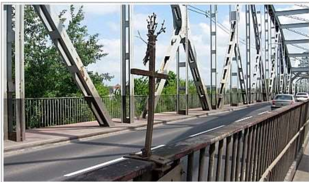
Krzyż upamiętniający miejsce wypadku Bronisława Malinowskiego na grudzińskim moście.