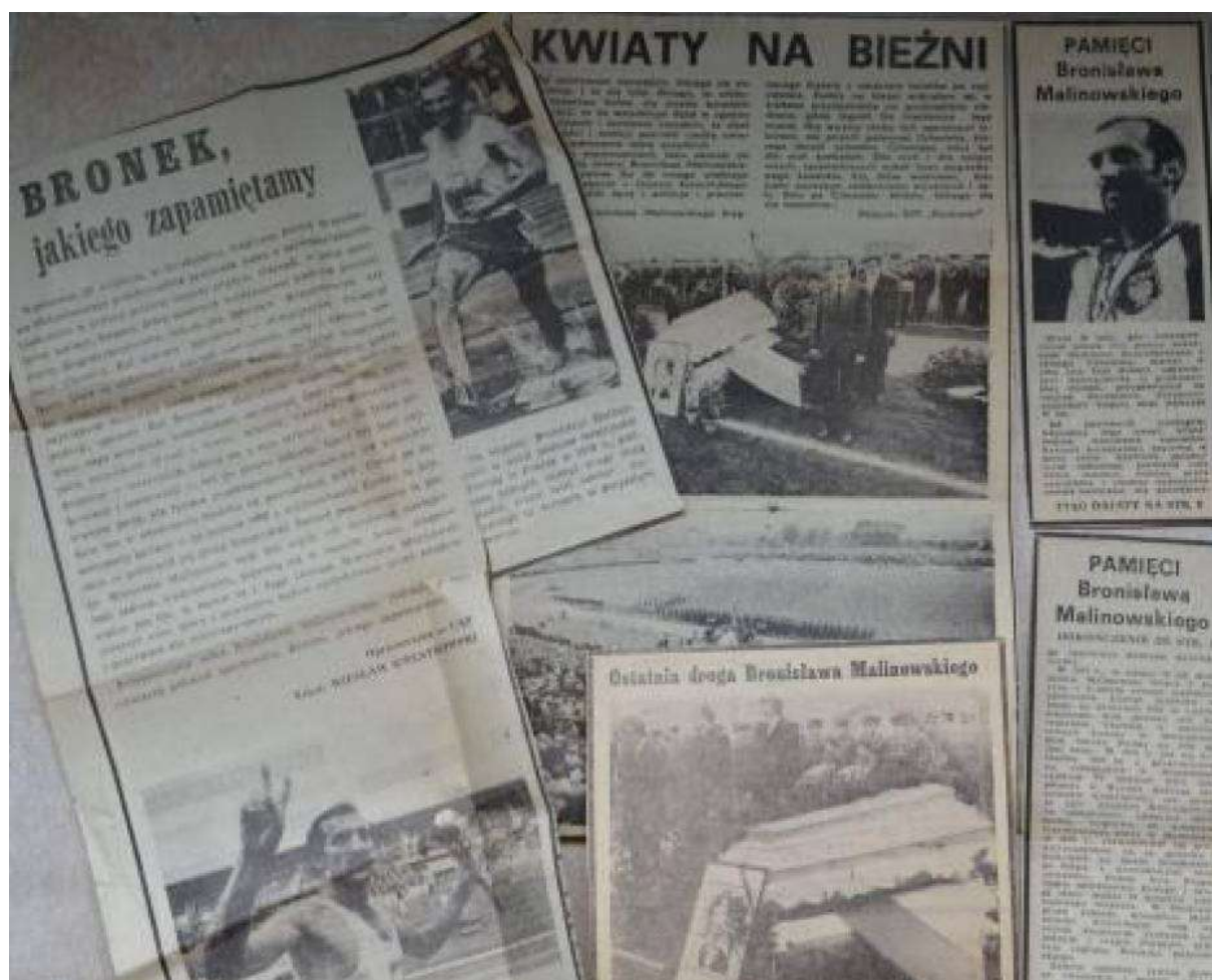
Archiwalne artykuły prasowe upamiętniające Bronisława Malinowskiego.