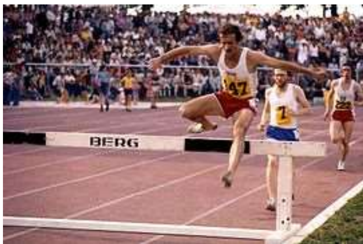
Mityng lekkoatletyczny w Fürth (RFN) w 1976 r.