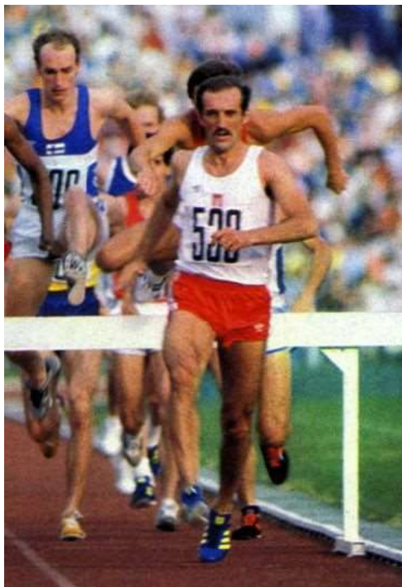
Bronisław Malinowski podczas zwycięskiego biegu na Olimpiadzie w 1980 r. w Moskwie.