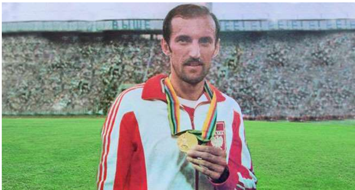
Bronisław Malinowski prezentuje zdobyty złoty medal na Olimpiadzie w Moskwie.