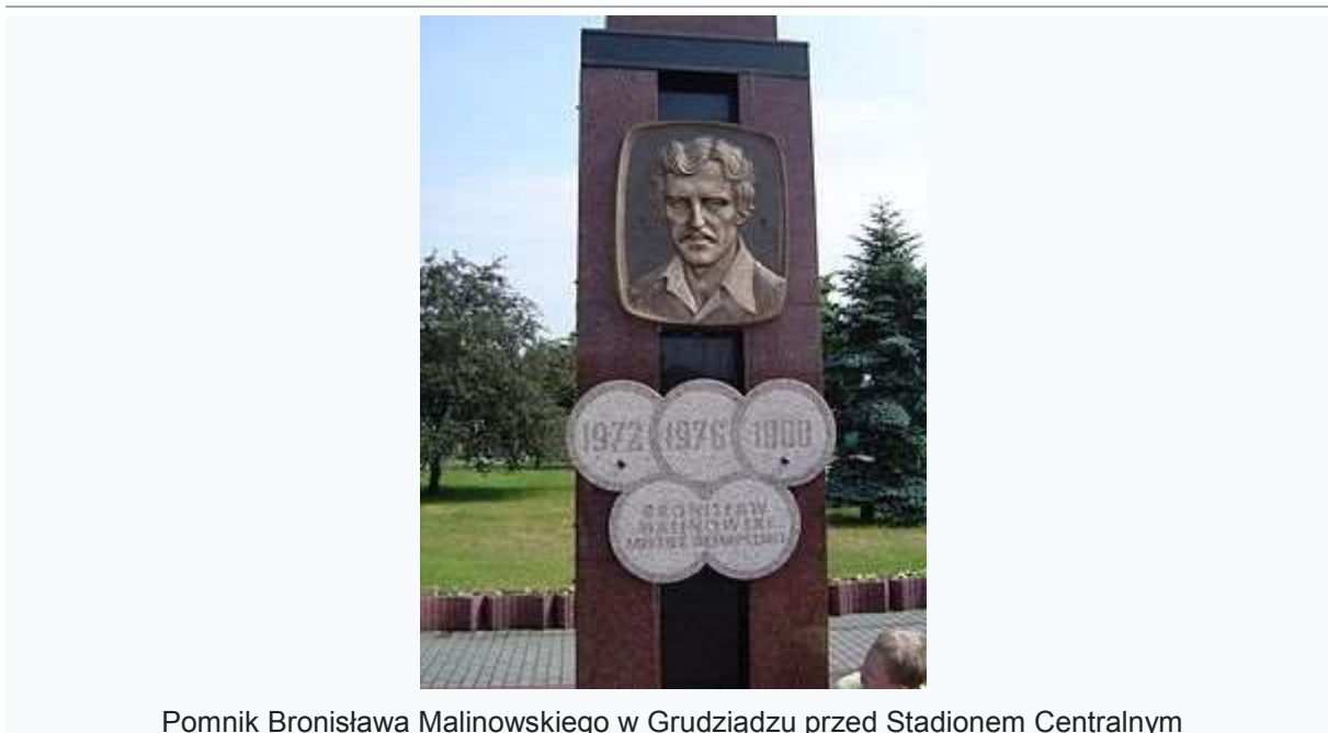
Pomnik Bronisława Malinowskiego w Grudziądzu przed Stadionem Centralnym

Po śmierci został wyróżniony nagrodą Fair Play, medalem za zasługi dla miasta Grudziądza, Złotymi Kolcami, tytułem Honorowego Mistrza Sportu, Krzyżem Kawalerskim Orderu Odrodzenia Polski. 18 września 1996 r. Rada Miejska w Grudziądzu nadała Bronisławowi Malinowskiemu tytuł Honorowego Obywatela Miasta Grudziądza. Jego imię nosi most w Grudziądzu, istnieje również Klub Szkół im. Bronisława Malinowskiego w całej Polsce. Jest patronem: Zespołu Szkół Publicznych w Osinie, Zespołu Szkół Ogólnokształcących nr 3 w Grudziądzu, Szkoły Podstawowej nr 47 w Bydgoszczy, Szkoły Podstawowej nr 12 w Tczewie, zespołu szkół samorządowych nr 2 w Boguszowie-Gorcach,