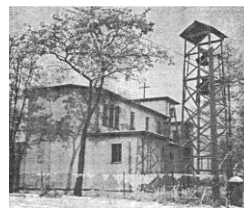
Turznice - kościół